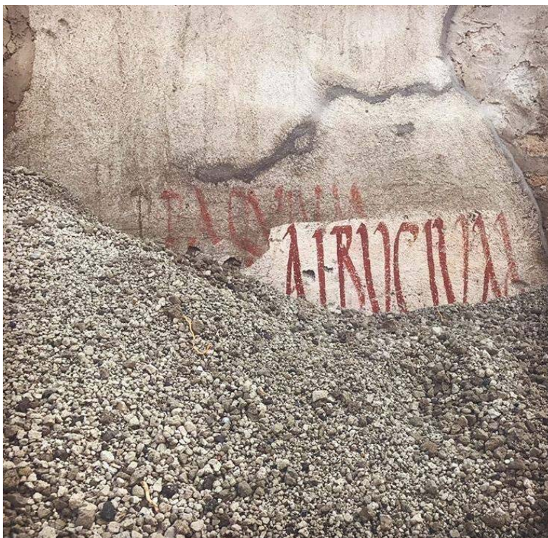
Fig. 1: Manifesti elettorali di Pompei con i nomi di due candidati che si sovrappongono 8