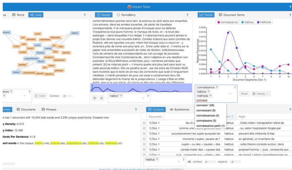
Figure 1. Exemple d'un des résultats de l'analyse de texte avec Voyant

Mais, au lieu de présenter surtout une lecture, pour ainsi dire 'de près', plus interprétative, critique, j'ai préféré proposer une lecture complémentaire. Pour ça, parallèlement à la lecture des textes de près, attentive, j'ai voulu faire un petit exercice et utiliser un outil d'analyse du texte ( Voyant ), conçue pour faire des listes de fréquence de mots et des graphiques de distribution de fréquence. Donc j'ai fait un exercice de 'lecture de loin', ou si on veut, 'distant' (Figure 1). 3 Ce type de lecture m'a été suggéré par Marin Picon elle-même lorsqu'elle dans son livre explique la méthode adoptée pour mettre en évidence les dynamiques sous-jacentes à l'élaboration d'une doctrine (entendue, comme elle le dit, comme un ensemble articulé de thèses), qui procède par reprises et transformations même à travers le langage dans lequel elle est énoncée. En conséquence, elle divise son travail entre "l'annotation des textes et leur commentaire, la première aimant pour tâche de reconduire les formules dans lesquelles la pensée de Leibniz prend forme aux traditions dont il les reçoit, le second de montrer comment cette pensée s'organise [...] en un ensemble démonstratif". 4